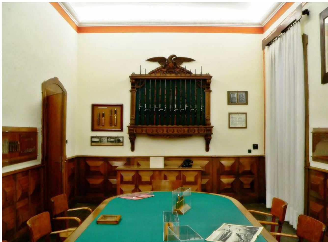
SALA DELLA PRESIDENZA CON COLLEZIONE DI FUCILI MILITARI