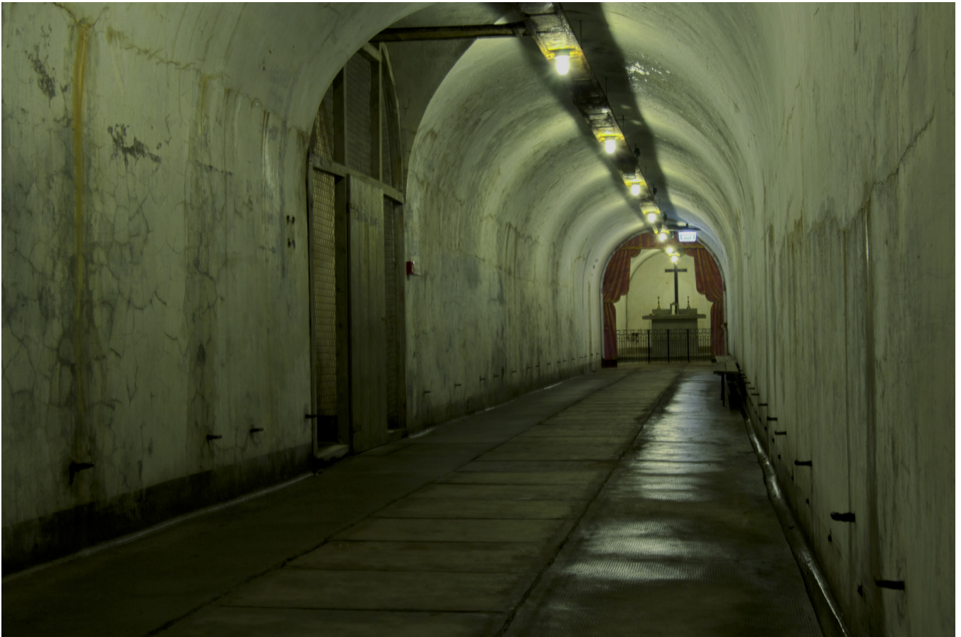
RIFUGI ANTIAEREI CAPPELLA DEDICATA A SANTA BARBARA