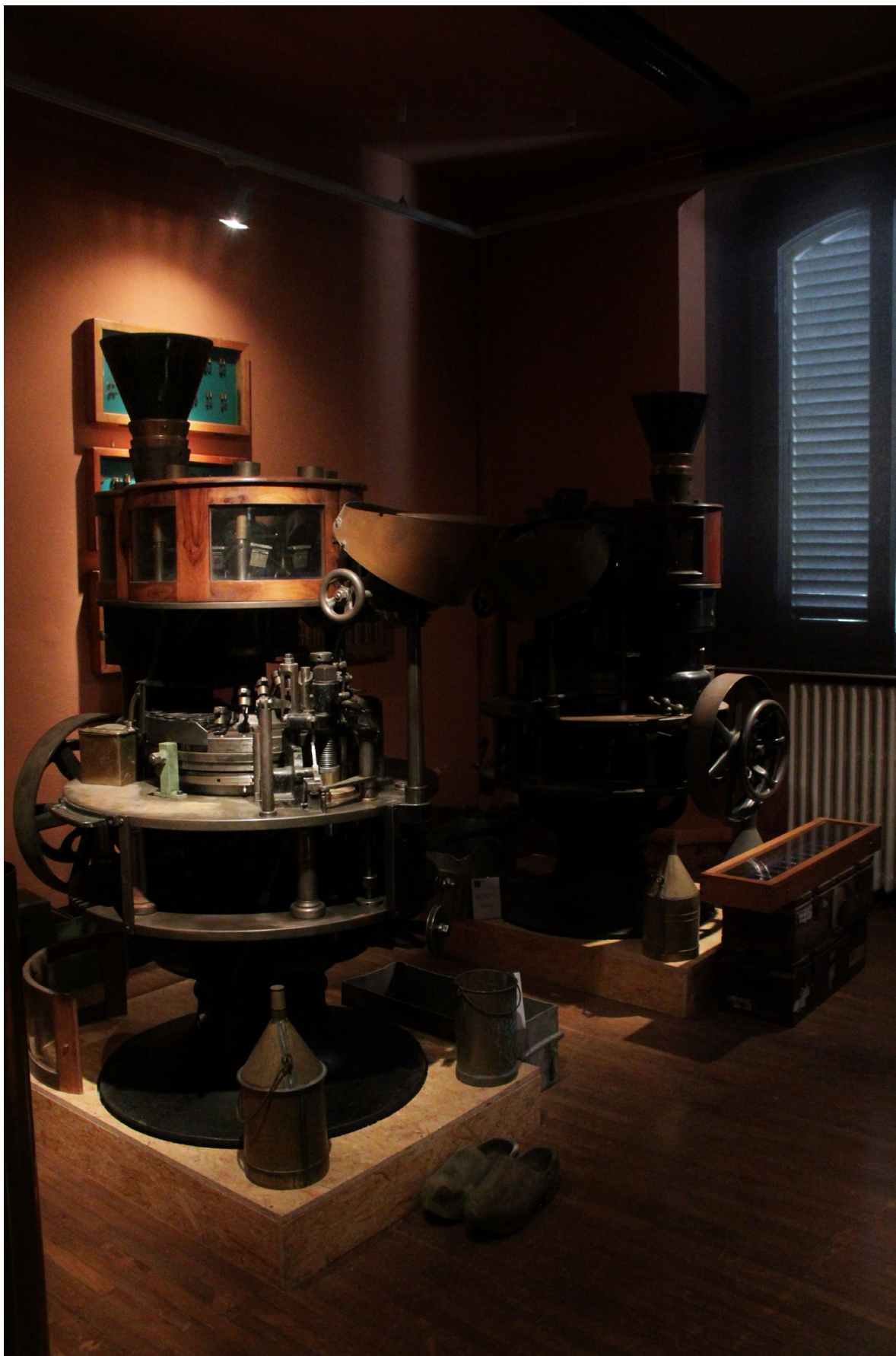
MACCHINE PER LA PRODUZIONE DI MUNIZIONI RISALENTI AI PRIMI DEL '900