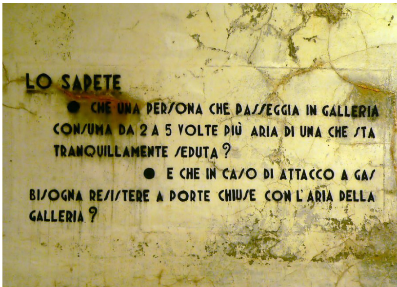
SCRITTA SUI MURI DEI RIFUGI ANTIAEREI