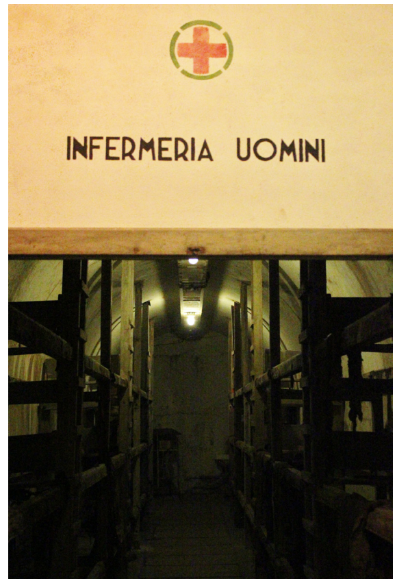
INFERMERIA UOMINI CON LETTI A CASTELLO IN LEGNO