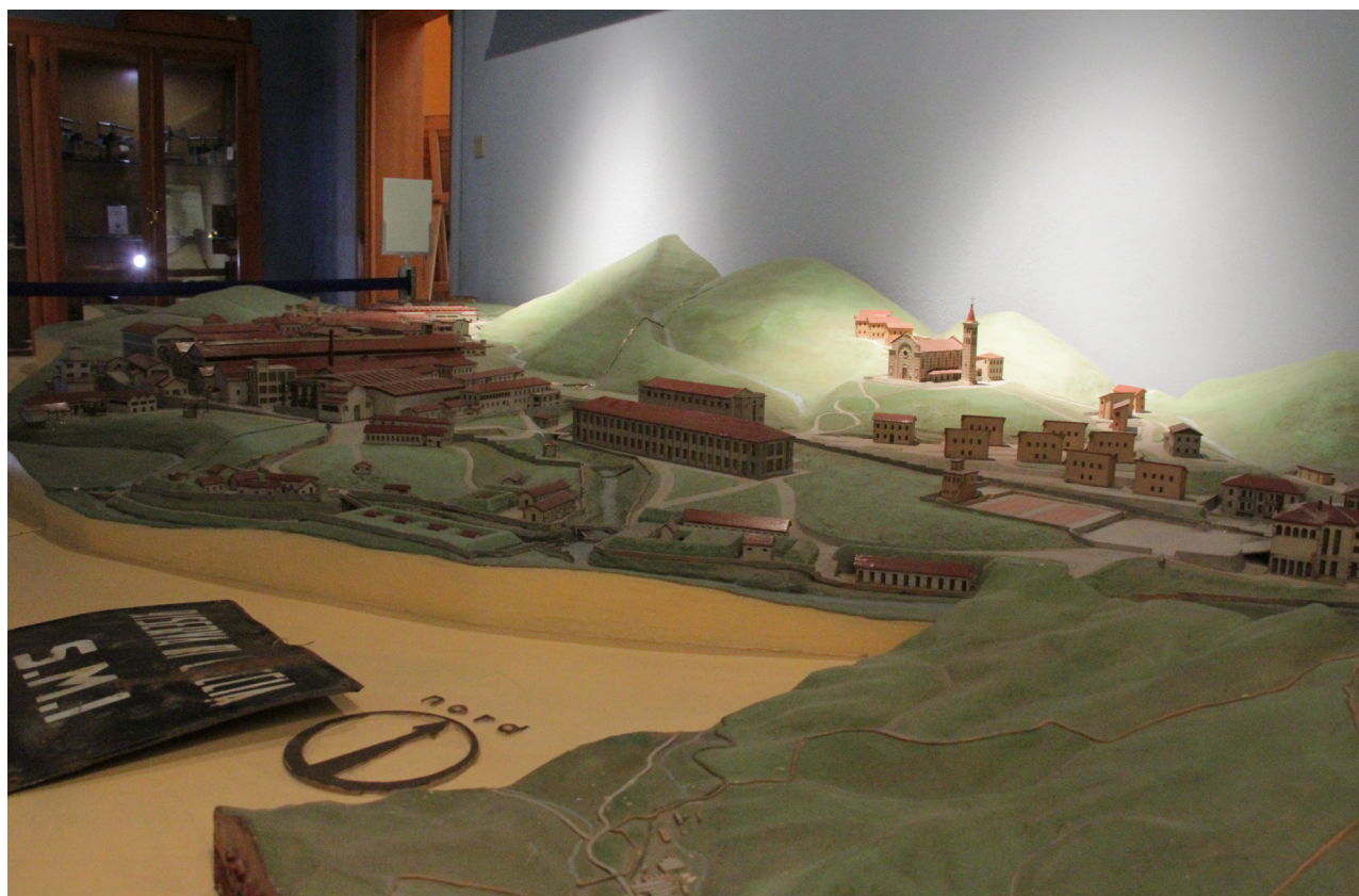
PLASTICO DELLO STABILIMENTO SMI E DEL VILLAGGIO ORLANDO DI CAMPO TIZZORO